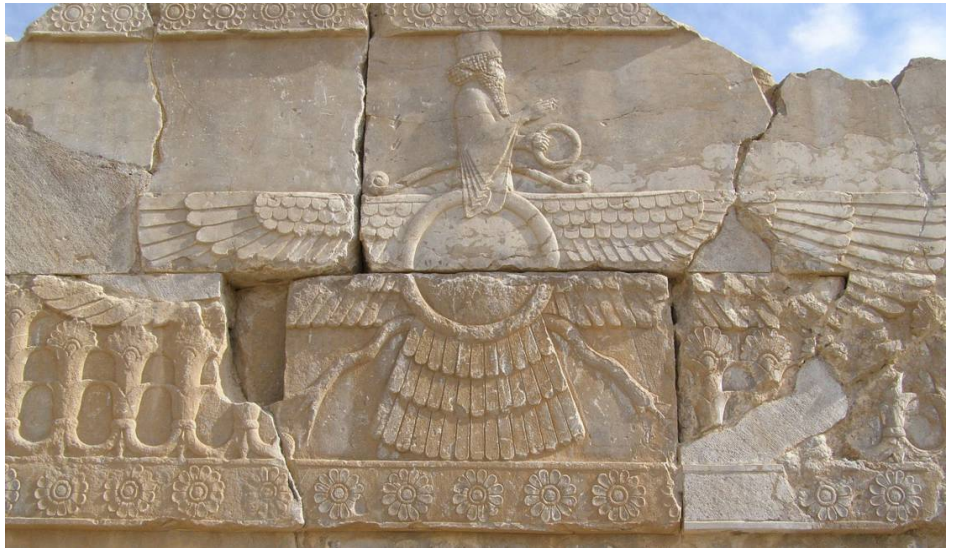
Le farvahar sur un bas relief de Persépolis, en Iran, daté 521 av J.C.