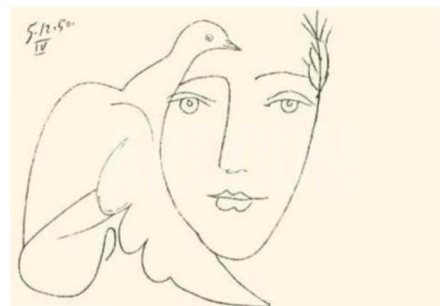
Illustration par Picasso du poème de Paul Eluard.

« Je connais tous les lieux où la colombe loge et le plus naturel est la tête de l'homme.