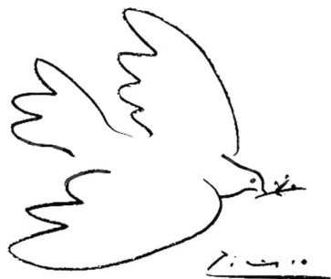
La colombe de la paix Picasso, 1949